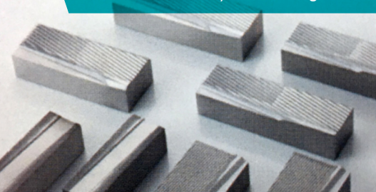
Turbinenschaufeln / Turbine Blade